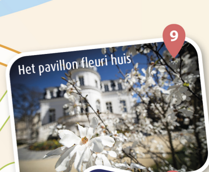
9 Het pavillon fleuri huis