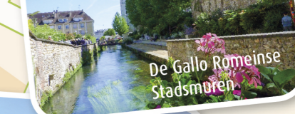
12 De Gallo Romeinse Stadsmuren