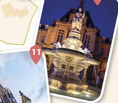
10 De fontein