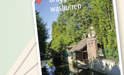
14 Bruggen en washuizen