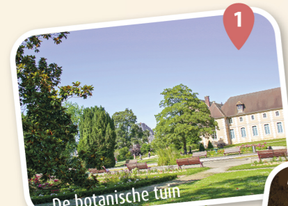
1 De botanische tuin