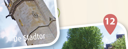
11 De Stador