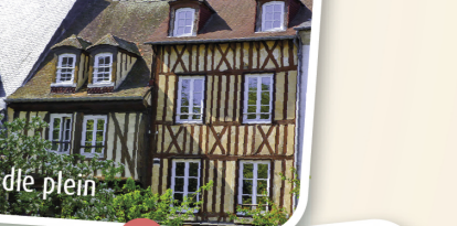
13 Het Mandie plein