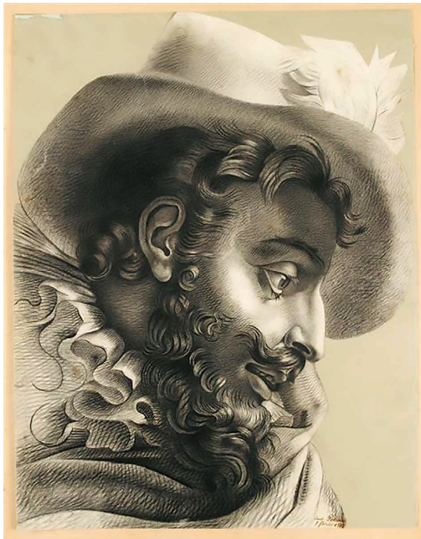
— Gravure Potonne

Les saisons sportives battent leur plein pendant la saison fraîche : basket, volley, football, rugby ou même handball ; tous les calendriers ALM / EVB / EFC / EAC / St Sé Handball sont en ligne sur notre site.