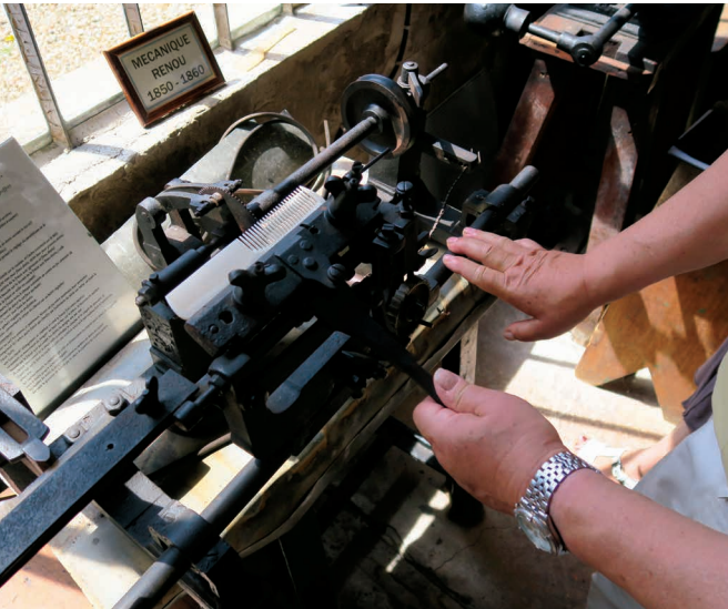
— Musée du Peigne et Parures

Le musée plonge les passionnés et amateurs de 7 e art dans une autre époque. Projecteurs, travelling, éléments de décor... L'espace dédié aux métiers et matériels techniques retrace l'histoire du cinéma et de la photographie à travers une collection exceptionnelle. Expo temporaire. Tous les samedis et dimanches de 14h à 18h00. Autres jours sur rendez-vous. 8 Grande Rue (Corum 1) 27730 Bueil 02 32 36 58 66