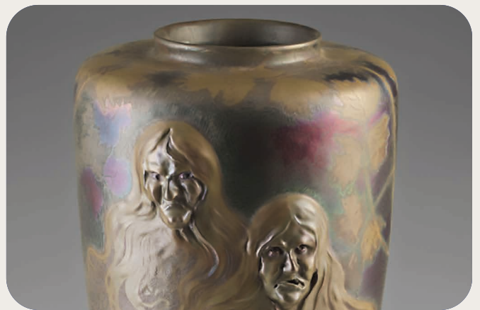
— Clément Massier, Vase aux sorcières, début du 20 e siècle © Musée départemental de l'Oise, Beauvais.