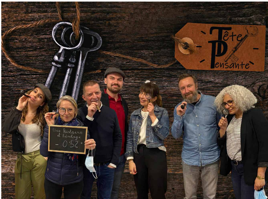
— L'équipe du Comptoir des loisirs - Février 2022